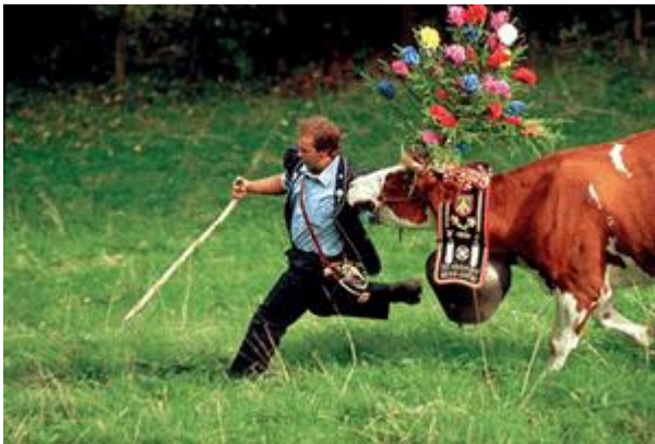
Májusi vetélkedő leaéneveknek Svájcban feldíszített májusfával

Május hónap folyamán, sok helyütt 1-én májusfát állítottak a természet újjászületésének szimbólumaként. A székelyek jakabfának, hajnalfának is nevezik. A források már a XV. században is említik ezt a szép szokást, de eredete valószínűleg még régebbi, a római Florália pogány szokásából eredeztethető. Ezeknek a több napig tartó fesztiváloknak a késői utóda a majális. Eredetileg